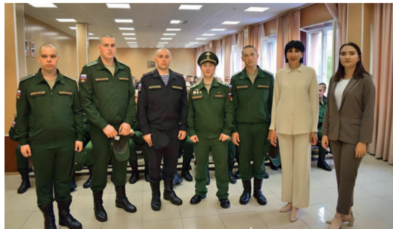
Призывники из Ирбитского района и Ирбита.

Служить в армии – это важный этап в биографии каждого молодого человека. В Российской армии он проходит не только хо-